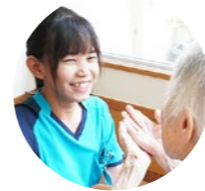
介護職 チョー スライン

— 仕事をする中で大変なことはなんですか。また、そのような場面で、どのように対応をしていますか。