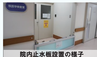
院内止水板設置の様子

また、職員による垂直避難訓練も随時開催しており、災害時における体制を強化しています。「地域のために、地域とともに」の理念のもと、災害に強い病院を目指してまいります。