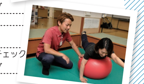
ゴムボールトレーニング