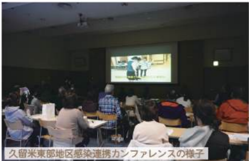
久留米東部地区感染連携カンファレンスの様子

この大会は、うきは地区防災協会及び浮羽消防署が「災害のない町づくり」をスローガンに、旧浮羽郡の各事業所の消火技術の向上、自主的な自衛消防体制の確立を目的として開催され、屋内消火栓の部には12組、消火器の部には15人が出場しました。当法人からは屋内消火栓の部に2組、消火器の部に1名が出場し、屋内消火栓の部では準優勝と3位入賞、消火器の部では準優勝し、5人全員が入賞するという素晴らしい結果となりました。