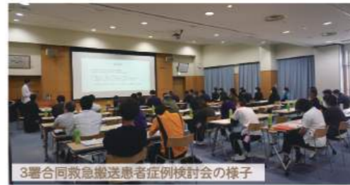
3署合同救急搬送患者症例検討会の様子