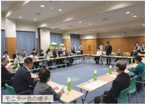
モニター会の様子