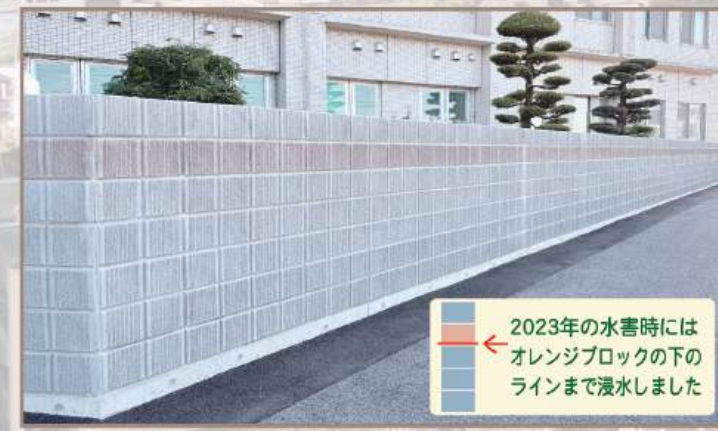
2023年の水害時には オレンジブロックの下の ラインまで浸水しました